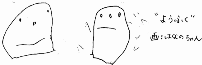
“ようぶく” 画:はなのらん