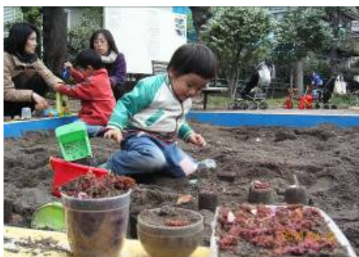
砂の蟹飯とスイーツいかがですか