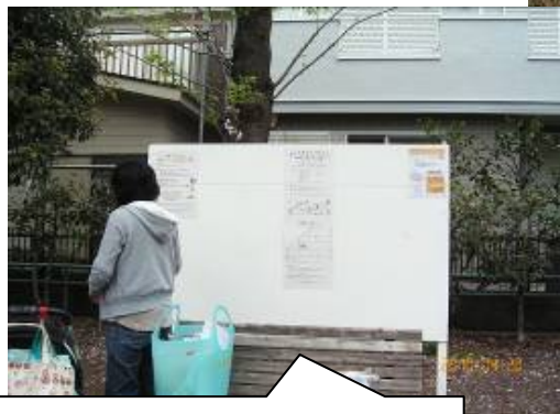
掲示i板が空いてます、掲示物 ご希望の団体の皆様、管理事務所 所にお越しく下さい「早い者勝ち」