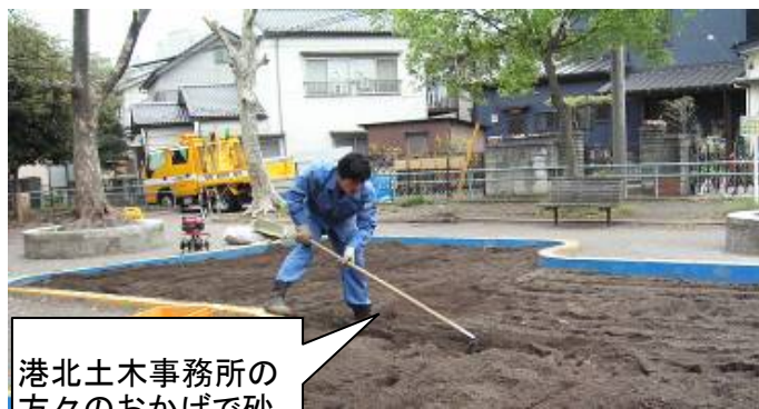
港北土木事務所の方々の おかげで砂場がフカフカです。