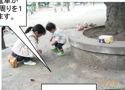
今回のシャボン液はとても良できました。